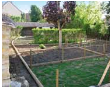
Mai 2012 : les parcelles délimitées

Pour se retrouver entre voisins dans un espace agréable, partager la même activité... descendons au jardin !