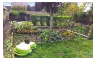
Octobre 2012 : les dernières récoltes de la saison